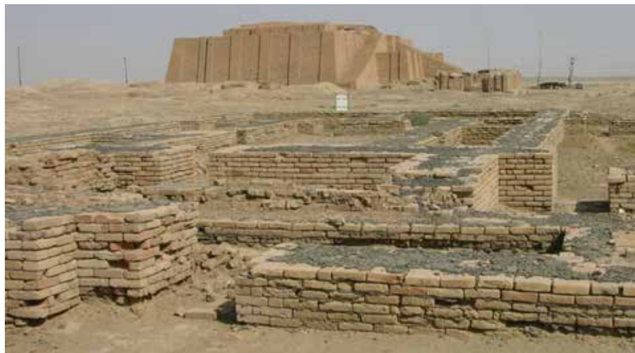
Spodná úroveň zikkuratu v Úre zrekonštruovaná Saddámom Husajnom v roku 1980