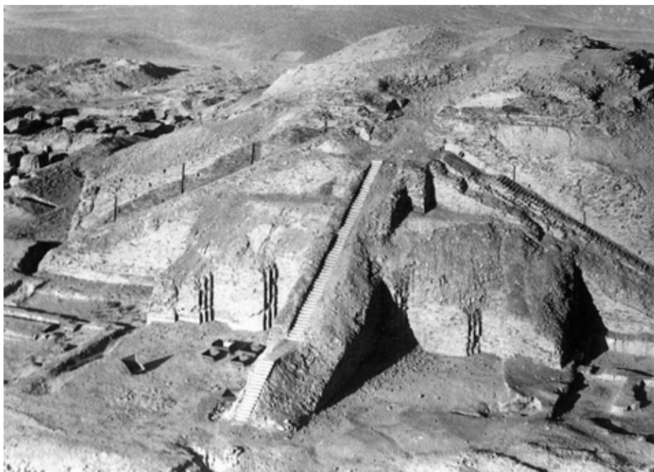
Zrúcanina zikkuratu v Chaldejskom Úre (fotografia z roku 1930)